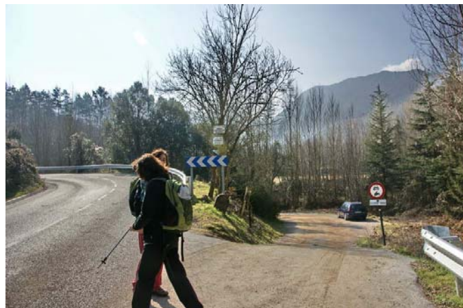
Pista de terra, inici de la ruta