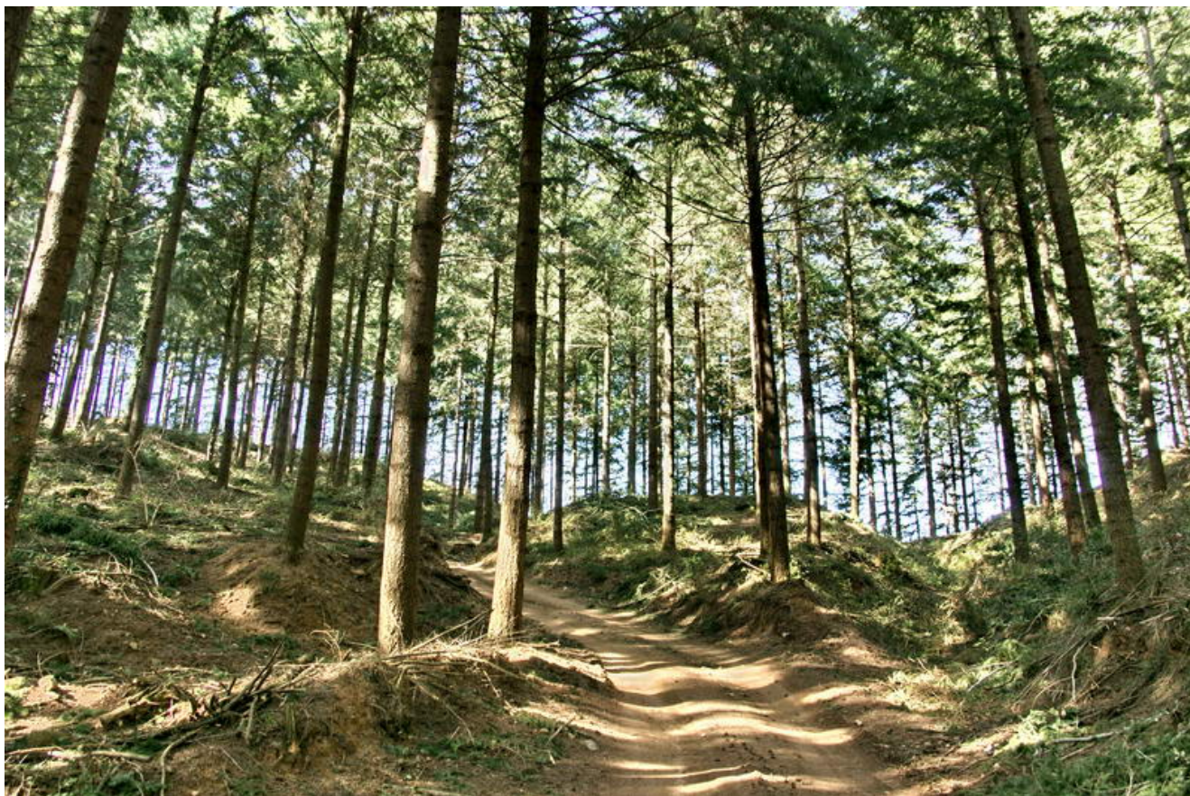
Bosc del Cominal

9,98 km (881 m), 2 h 23 min. Coll de Querós. Bifurcació: es continua pel camí que puja a la dreta en direcció nord-oest. 700 m més enllà es troba una bifurcació: es deixa un camí que puja a la dreta i se n'agafa un altre que baixa lleugerament per l'esquerra.