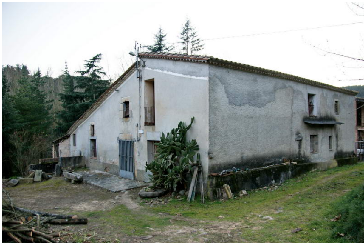
Ca l'Agustí, a Santa Coloma de Farners

[Amb la Joana] van fer cap, de nou, al mas Agustí de Santa Coloma de Farners, allà on en Serrallonga creia tenir encara els fautors més fidels lluny de la zona de Querós. I s'instal·laren una altra vegada en la cabana rònega del bosc, d'on pràcticament no sortien per por de trobar-se amb alguna partida de soldats del rei o amb un sometent acabat d'aixecar. El que en Joan Sala no sabia era que, malgrat totes les precaucions, d'aquell amagatall fred i pudent en sortiria viu, però no lliure.