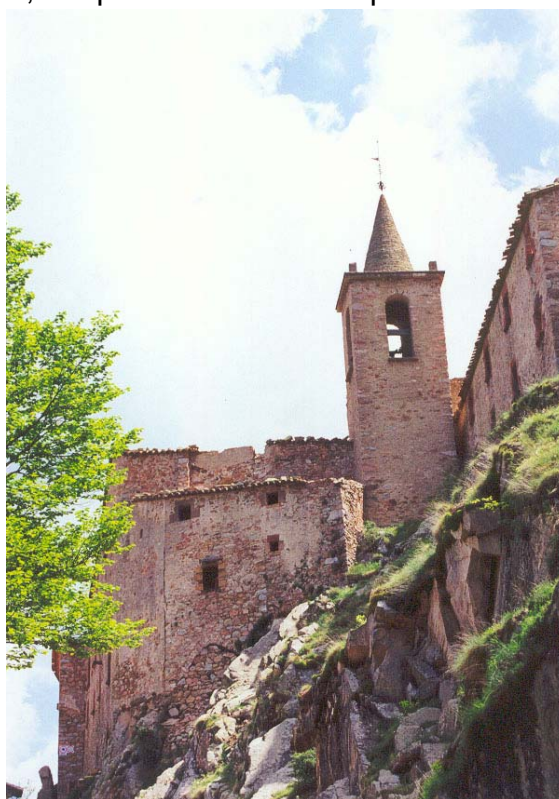
Santuari de Sant Segimon