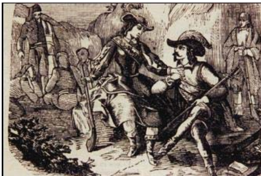
Joana Massissa i Serrallonga

A empentes i amb el pedrenyal a la mà, amenaçant-la de mort a cada pas, aquell proscrit que ja no capitanejava cap quadrilla la va conduir, per un serrat, fins a la jaça d'uns pastors. L'endemà, a mig camí d'aneu a saber on, la noia va patir un lleu mareig. No tenia res a veure amb la seva malaltia. S'havia negat a menjar res i com a conseqüència se sentia defallida. En Serrallonga la va obligar a beure vi de la seva carabassa i això la va reviscolar. Es va refer fins a l'extrem que va gosar escopir a la cara del raptor i acompanyà l'ofensa amb un insult. Aquell, enfurismat, va tancar els punys i va serrar fort les dents, per no ventar-li bufetada. Segurament la trobava massa bella per marcar-li la cara amb els dits. Es van quedar mirant, en silenci, una bona estona, desafiant-se l'un a l'altra. Ella projectava odi a través de la mirada i ell, barrejada amb la ràbia, no podia dissimular una espurna de desig. Per fi, l'home es va girar i, sense badar boca, continuà caminant muntanya avall, amb grans gambades i deixant-la sola. Sabia que ella, sense tenir idea de cap a on anar, perduda enmig d'un bosc ple de llops, espadats i altres perills, decidiria seguir-lo i es posaria a córrer al seu darrere, com així va fer. No era el millor moment per separar-se, i tots dos ho sabien. Van passar uns dies sense dir-se res, al cap dels quals la noia s'adonà que — fos per la por o bé per l'aire muntanyenc— ja no tenia febre. [...]