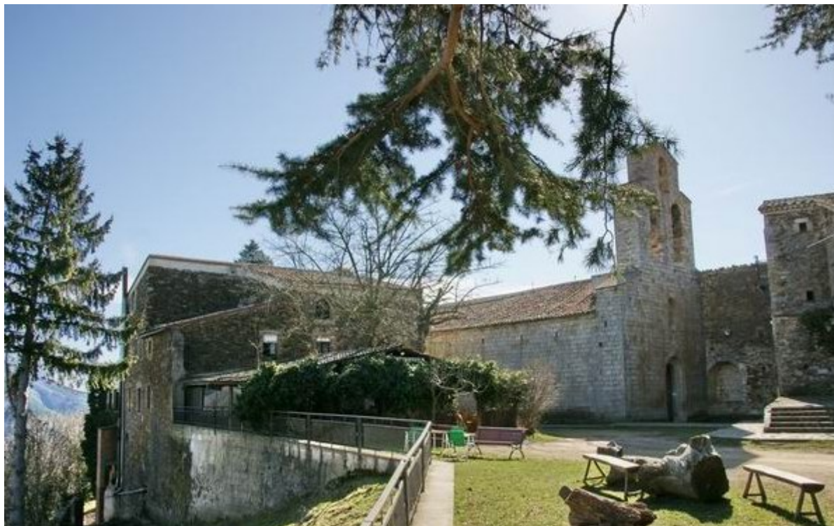
Santuari de la Mare de Déu del Coll

22,23 km (823 m), 5 h 18 min. S'arriba al santuari de la Mare de Déu del Coll.