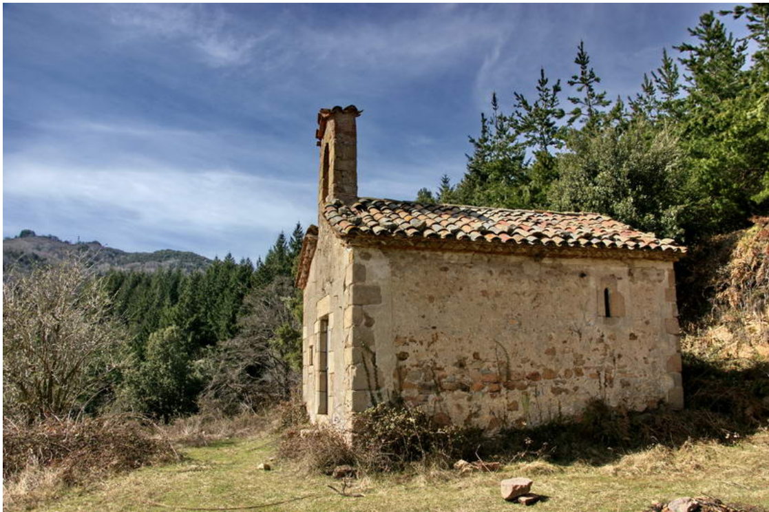
Ermita del Carbonell

9,53 km (843 m), 2 h 16 min. Nova bifurcació de pistes. Es deixa la que puja a la dreta i se segueix recte. Als pocs metres es bifurca un altre cop: cal pujar per la de la dreta.