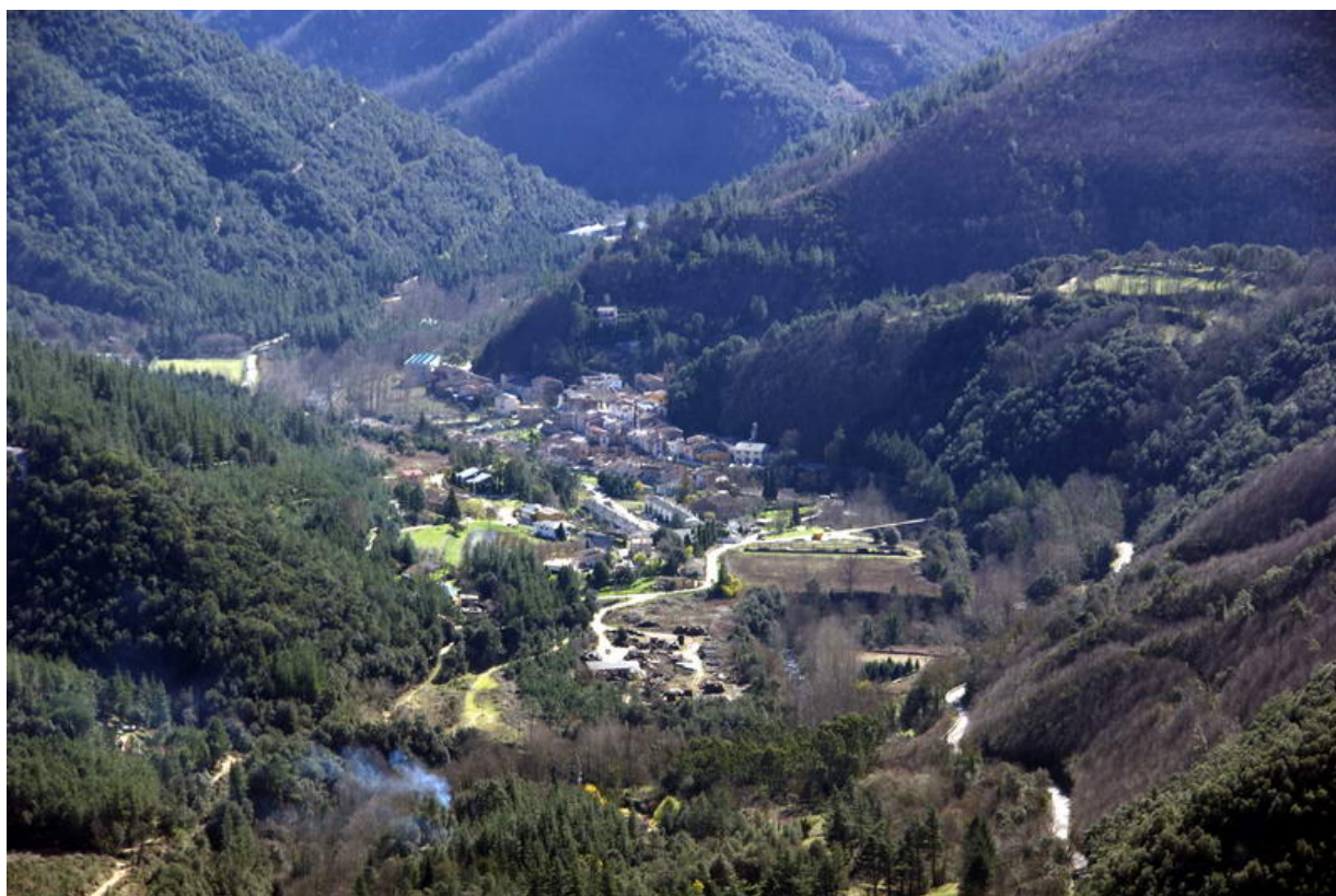
Osor des del Santuari de la Mare de Déu del Coll