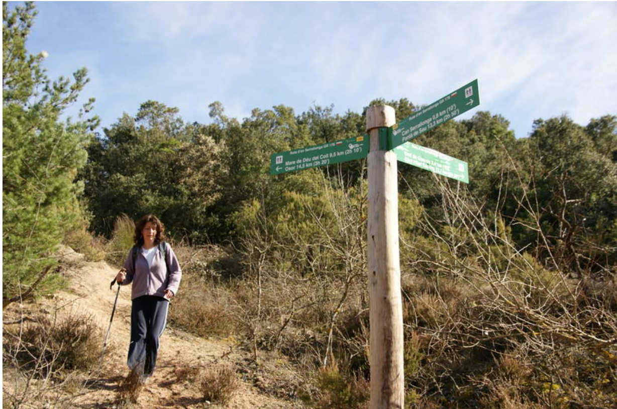
Coll de Serrallonga. Indicacions

Pocs metres després el camí es bifurca novament. Hi ha indicacions que ens orienten per anar al Mas Serrallonga (d'on Joan Sala prengué el nom) pel camí de l'esquerra. Al cap d'uns 15 minuts anant pel camí, a l'esquerra, trobem les restes del mas, que està molt deteriorat. Després, tornem a enfilar el sender cap on hi havia les bifurcacions i en aquest cas agafem el camí de la dreta.