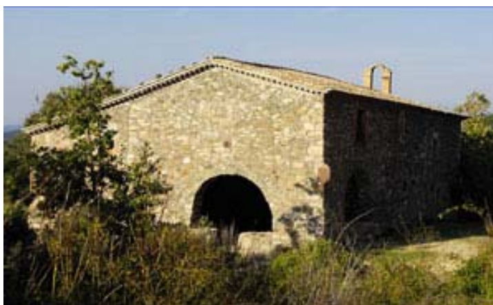
Ermita de Mare de Déu de l'Erola ( http://www.senderisme.tk/wp-content/fotos/matagalls/erola.jpg )

A l'ermita de l'Erola deixem el camí de Viladrau, que segueix recte i agafem la pista que passa per davant de la façana de l'ermita. Uns metres després podem optar per seguir aquesta pista o per agafar el camí antic, que es desprèn a la seva esquerra i que es retroba amb la pista prop de Can Gat.