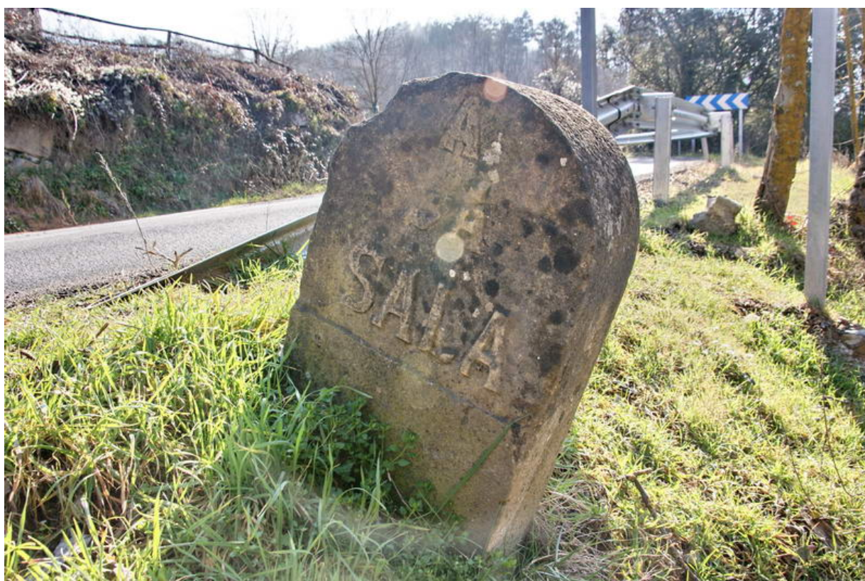
A la Sala