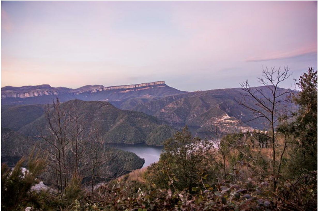
Pantà de Susqueda i santuari del Far al fons.

La Joana, es veu, fa dies que no menja ni parla i només té ulls per lo bosc, surt a passejar sola, s'està llargues estones mirant cap el vessant que dóna a Vic i l'altre dia que fou el primer que hi va haver boira, aquest any, fins i tot es va perdre pel camí de l'Obra Nova. «Ja m'ho deia ma mare: "el Montseny fa perdre el seny de les dones prenyades", i pensar que vaig ser jo qui la hi vaig menar!», ha acabat dient.