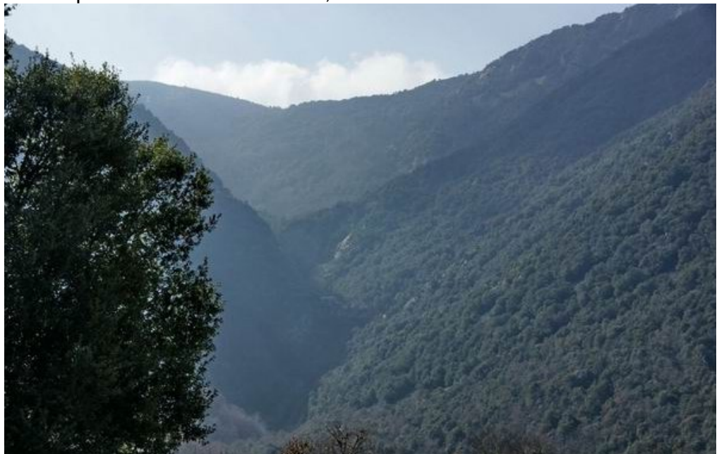
Torrent dels Rentadors

Aquí, gent i país són una mateixa cosa perquè d'un n'emana l'altre, des de l'aspror de la pell fins al caràcter. I malgrat que la terra és difícil i esquerra i que no hi ha pare que no li digui al seu fill que marxi a provar fortuna a un altre indret, abans o després, potser ja vell i cansat, aquest torna sempre a la casa paterna. Perquè només aquí sap que, entre boscos espessos i rieres tortuoses, la seva mirada troba el recer necessari per fer balanç del que li ha donat la vida lluny de la muntanya estimada. I és així com sap que n'havia de marxar per aprendre a estimar-la, i és llavors que descobreix que el vincle entre ell i el seu llinatge passa, per sempre més, per la terra que l'ha vist néixer i el veurà morir.