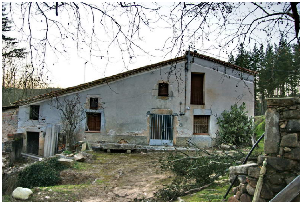
Ca l'Agustí, a Santa Coloma de Farners

A finals d'estiu, l'exèrcit ja ha detingut també molts dels seus protectors [...], tots confessen el que saben, que en Serrallonga vaga sol amb la seva amistançada Joana, que viuen per coves i boscos i que només rarament es deixen veure per algun llogarret.