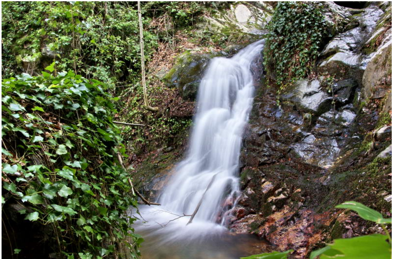
El gorg Negre

És un gorg força gran, amb una estreta i llarga cascada i amb un altre gorg important a sota. El conjunt és feréstec i corprenedor. Continuarem torrent amunt. Per això hem de tornar enrere i seguir el camí de pujada que hem deixat. La pujada és forta, però amb magnífiques vistes sobre el torrent de Rentadors i sobre tota la vall de Can Gat, fins a Viladrau. Després de 16 minuts de pujar (975 m) cal posar atenció, perquè el nostre corriol aparentment es desvia cap a la dreta i planeja una estona a mitja falda de la muntanya d'en Sala, però en realitat agafa un trencall a l'esquerra, de manera que no abandona el torrent. Si es para atenció, hi ha senyals vermells i fites que ajuden a orientar-se. El camí primer baixa una mica i després torna a pujar, més suau. Som al Pas d'en Marc, tallat a la roca. Després el camí baixa suaument fins a arribar a tocar del torrent, on comença a veure's fageda.