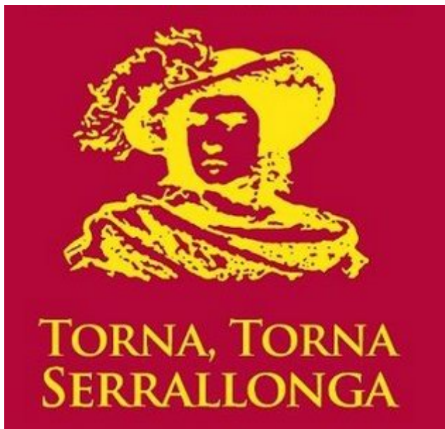
Logotip de l'Estiu Bandoler de Viladrau

Torna, torna, Serrallonga, que l'alzina ens cremaran, que ens arrencaran les pedres, que la terra ens robaran.