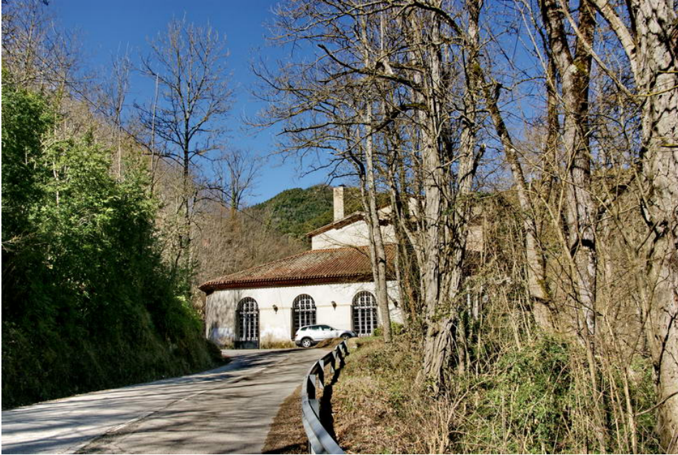
Balneari de la Font Picant

2,47 km (857 m), 0 h 36 min. Es deixa la pista del Subirà a la dreta (E) i es baixa a l'esquerra (NO) per un camí ample senyalitzat com a «Ruta de Bosc i Patrimoni» que es dirigeix a Sant Hilari Sacalm i la font de Sant Roc. Tot el camí està senyalitzat amb les marques blanques i vermelles del GR 178.