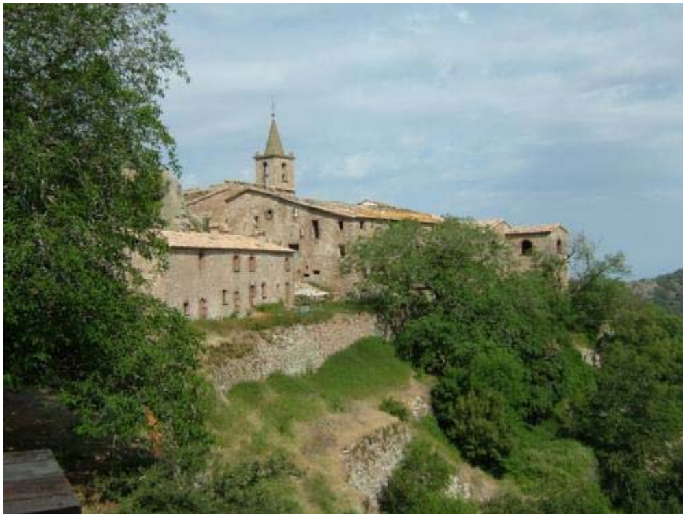
Santuari de Sant Segimon

La tornada la farem pel tradicional camí de Sant Segimon a l'Erola, ja descrit en altres itineraris i que no té pèrdua, ja que és molt transitat. És un camí molt bonic, pedregós en alguns trams i que té l'atractiu dels antiquíssims i voluminosos castanyers que es troben ja prop de l'ermita de l'Erola.