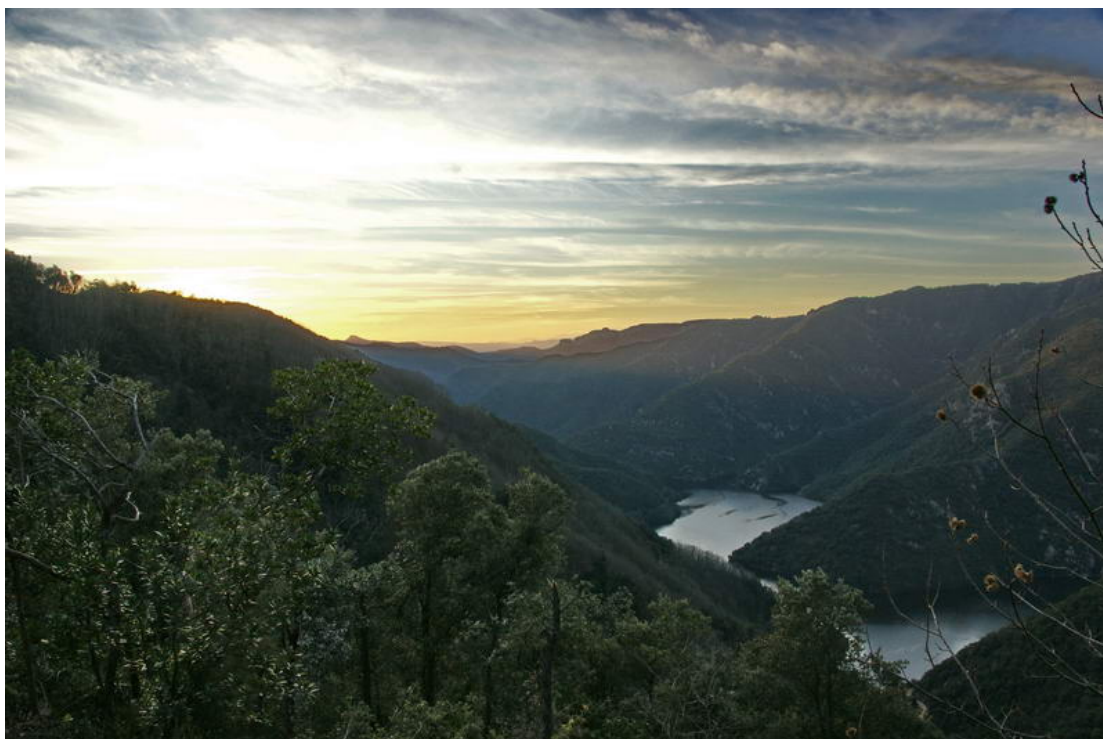
Pantà de Susqueda

La pressió, tanmateix, era tan forta que en Joan Sala, tement que al capdavant l'atraparien, va haver de fugir, per primer cop i tot sol, a França. Quan va tornar a Querós, la colla dels Margarit havia estat desmantellada, bona part dels qui hi bandolejaven es manifestaven disposats a unir-se a ell i, per tant, la testa del viladrauenc seria a partir d'aleshores més cotitzada que mai davant la justícia.