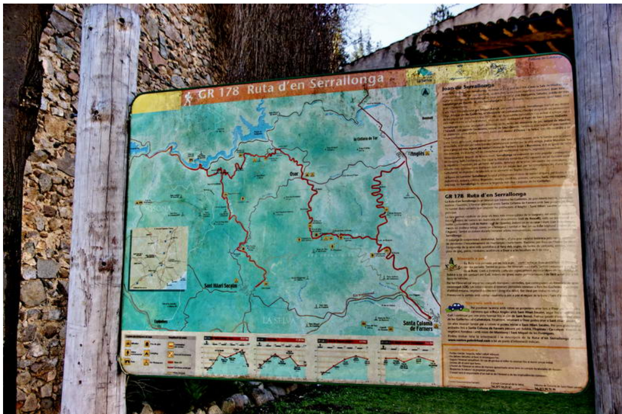
Rètol informatiu de la Ruta Serrallonga a Sant Hilari Sacalm