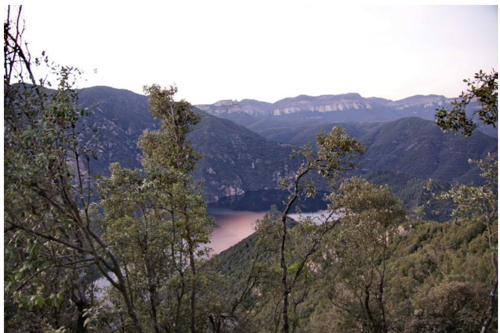
Pantà de Susqueda