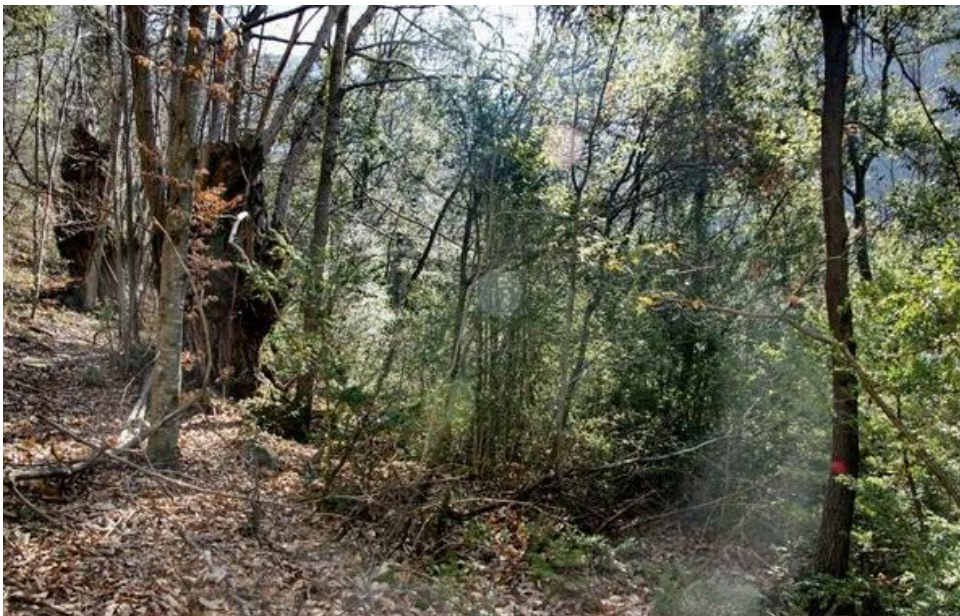
Camí cap al torrent

Agafem un corriol que, a mà esquerra, s'enfila al costat del torrent de Rentadors. A partir d'aquí el pendent és força pronunciat. Un minut després de començar la pujada per aquest corriol, es desvia a l'esquerra un altre corriol que duu al torrent. Continuant pel corriol de pujada (hi ha alguns senyals vermells de tant en tant) al cap de cinc minuts trobem, a mà esquerra i amb senyals vermells, el corriol que porta al Gorg Negre.